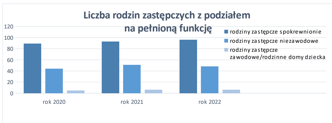
Wykres 1. Liczba rodzin zastępczych w latach 2020 – 2022 (stan na 31 grudnia każdego roku)